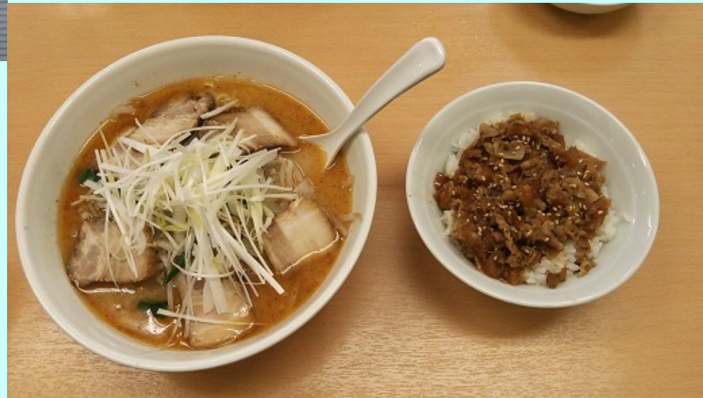
↑ 味噌タンタンメン(チャーシュートッピング)、焼肉丼セット